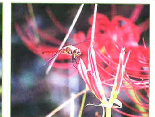
toyanogatapark トンボいます〜。 #トンボ #ヒガンバナとトンボ #秋だね #新潟 #niigata #鳥屋野湯公園 #toyanogatapark #park #女池地区 2022年9月19日