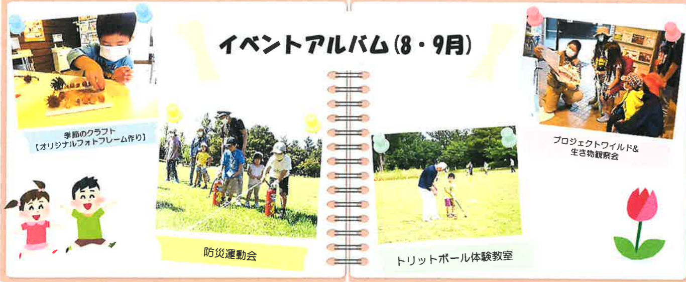
季節のクラフト 【オリジナルフォトフレーム作り】