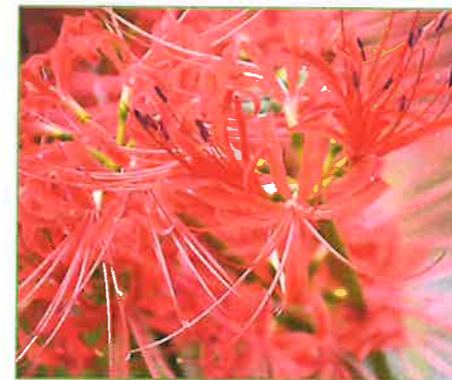
toyanogatapark 鐘木地区のヒガンバナ、今週末見頃を迎えそうです(〃) #植物 #ヒガンバナ #今週末 #見頃 #かも #新潟 #niigata #鳥屋野湯公園 #toyanogatapark #park #鐘木地区 2022年9月21日