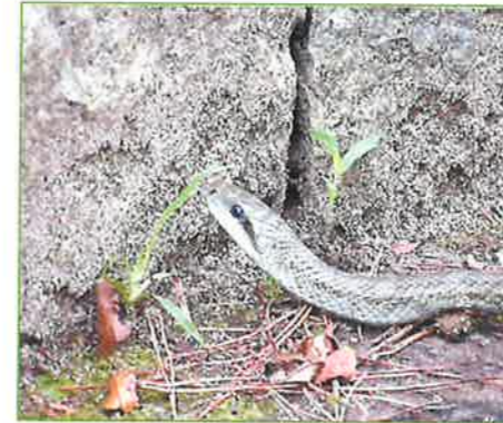
toyanogatapark アオダイショウの写真です! #爬虫類 #アオダイショウ #新潟 #niigata #鳥屋野湯公園 #toyanogatapark #park #鐘木地区 2022年9月5日

Instagramの公園アカウントでは、園内の見どころ情報やイベント情報など鳥屋野湯公園に関する様々な情報を発信しています!!