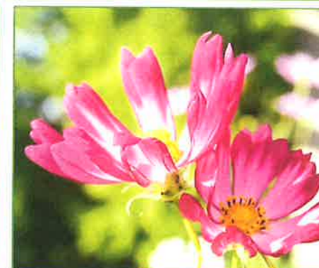
toyanogatapark コスモスの写真です! #コスモス #新潟 #niigata #鳥屋野湯公園 #toyanogatapark #park #女池地区 2022年9月21日