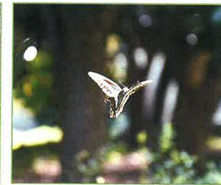
toyanogatapark アオスジアゲハの写真です。 #アオスジアゲハ #新潟 #niigata #鳥屋野湯公園 #toyanogatapark #park #鐘木地区 2022年9月13日