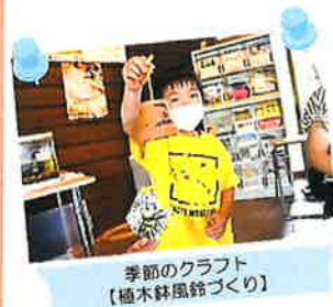
季節のクラフト 【樹木幹風鈴づくり】