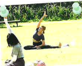
パークヨガ(女池地区)