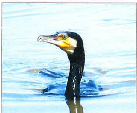
toyanogatapark カワウ(目がめちゃくちゃ綺麗です!)の写真です! #野鳥 #bird #カワウ #目 #綺麗 #新潟 #niigata #鳥屋野潟公園 #toyanogatapark #park #鍾木地区 2022年7月13日