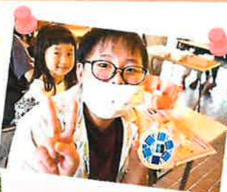
湯キッズ 【ガラススタイルコースター作り】