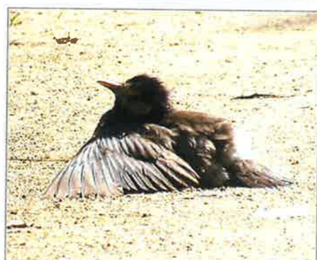
toyanogatapark ムクドリが園路で日光浴中でした! #野鳥 #bird #ムクドリ #なぜ #園路で #日光浴 #新潟 #niigata #鳥屋野潟公園 #toyanogatapark #park #鍾木地区 2022年7月11日