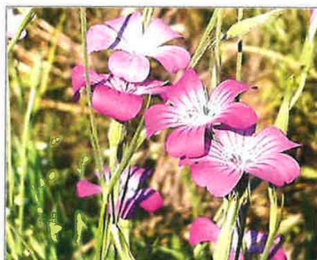
toyanogatapark ポラントニアの方と初めて種を蒔いたムギナデシコの花が咲きました! #植物 #花 #ムギナデシコ #新潟 #niigata #鳥屋野潟公園 #toyanogatapark #park #鍾木地区 2022年7月7日