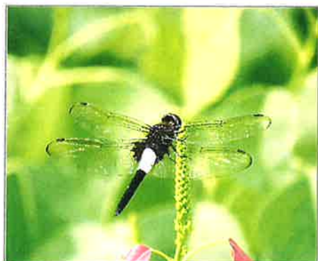
toyanogatapark コシアキトンボ(オス)の写真です! #昆虫 #トンボ #コシアキトンボ #新潟 #niigata #鳥屋野潟公園 #toyanogatapark #park #鍾木地区 2022年7月3日

Instagramの公園アカウントでは、園内の見どころ情報やイベント情報など鳥屋野潟公園に関する様々な情報を発信しています!!