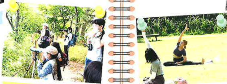
バードウォッチング