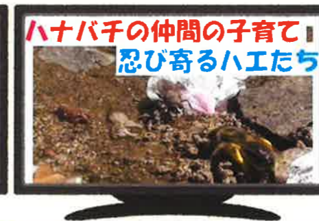
【ハナバチの仲間の子育て】