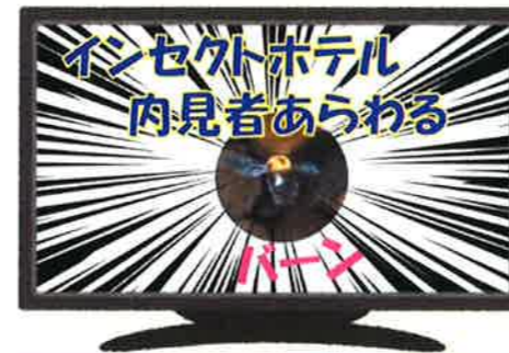
【インセクトホテル内見者あらわる】

4月のはじめに設置したインセクトホテルに、内見虫があらわれました。なんの虫でしょうか？