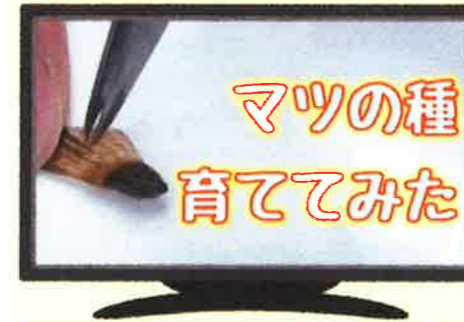
【マツの種育ててみた】

マツの種がどこにあるか知っていますか？マツの種採りから芽が出るまでを観察してみました。