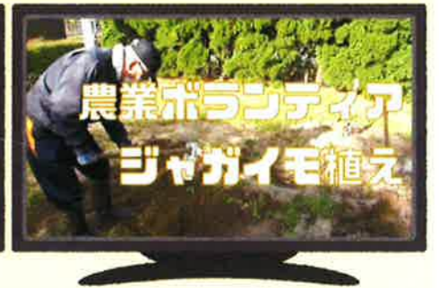
【農業ボランティア ジャガイモ植え】

今年度から、農作物の栽培を始めました。記念すべき第一弾として、ジャガイモを植えました。