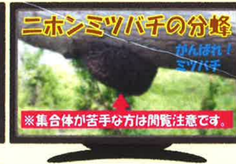
【ニホンミツバチの分蜂】

女王バチが新女王バチに巣を譲り、約半数の働きバチを連れて新天地に向けて旅立っていました。