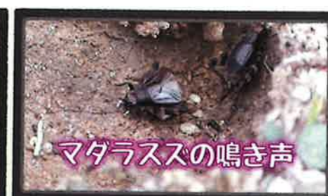
マダラスズの鳴き声

【マダラスズの鳴き声】 秋の虫の鳴き声シリーズ第5弾!!園内で見つけたマダラスズの鳴き声の映像です。