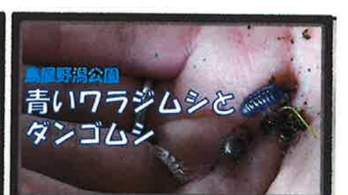
青いワラジムシとダンゴムシ

【青いワラジムシとダンゴムシ】 園内で、青いワラジムシやダンゴムシを発見!! どうやらウイルスに感染した個体のようです。