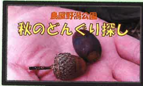
秋のどんぐり探し

【秋のどんぐり探し】 園内で見つけることのできるどんぐりをご紹介します映像です。これであなたもどんぐり博士!!