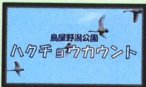
ハクチョウカウント

【ハクチョウカウント】 冬期間、鳥屋野潟ではハクチョウの飛来数をカウントしています。ある日のカウント風景です。