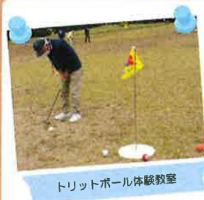
トリックボール体験教室