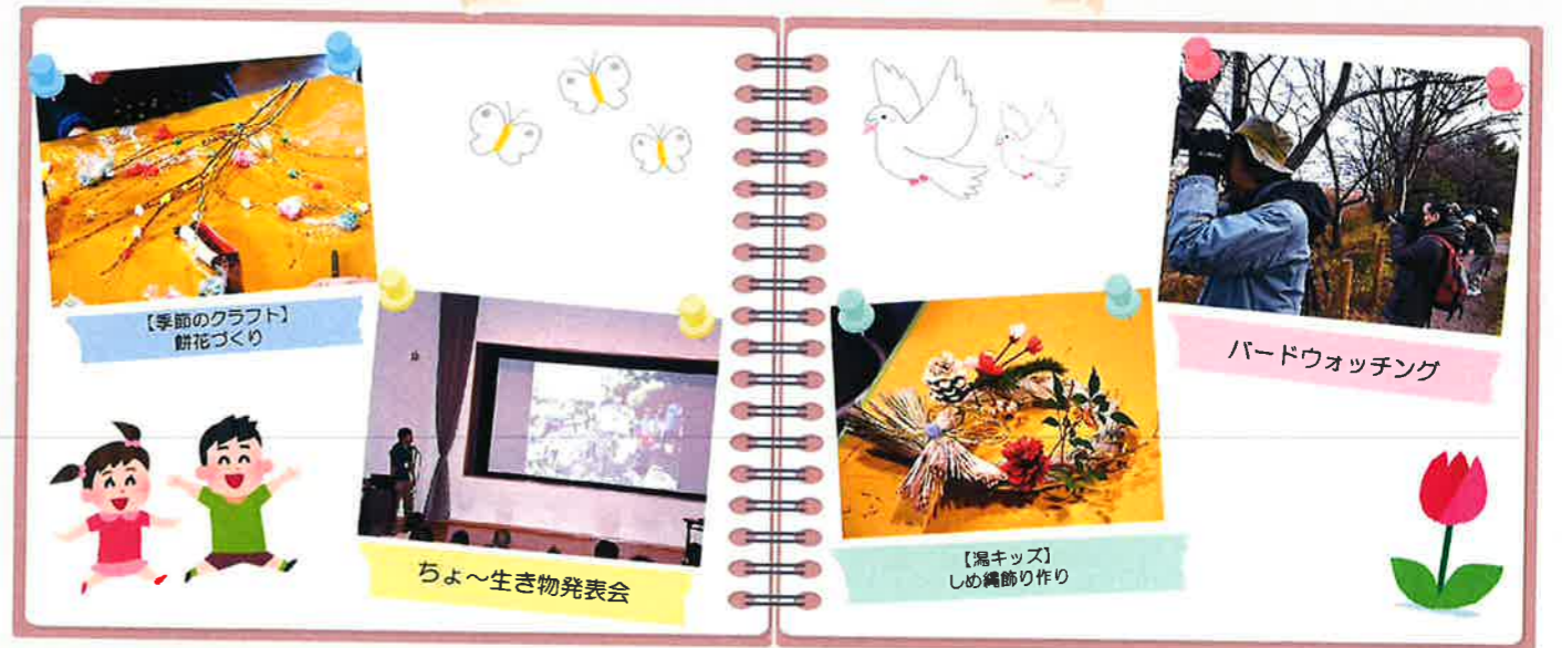
【季節のクラフト】 餅花づくり