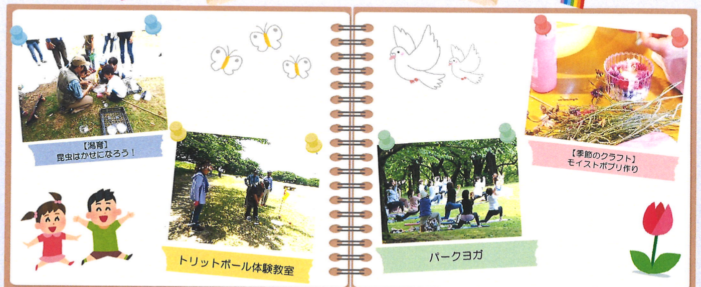
【湯育】 昆虫はかせになろう!