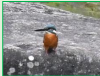
カワセミ科： カワセミ