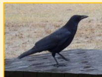
カラス科： ハシボソガラス