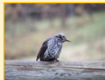
ヒヨドリ科： ヒヨドリ