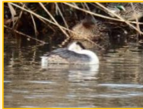
カイツブリ科： カンムリカイツブリ