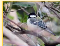
シジュウカラ科： シジュウカラ