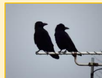
カラス科 ハシブトガラス