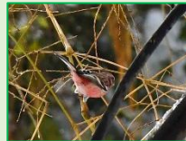
アトリ科： ベニマシコ