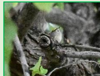
キクイタダキ科： キクイタダキ