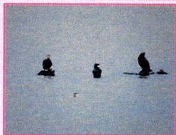
カツオドリ目ウ科 カワウ