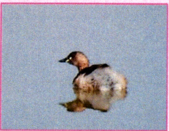
カイツブリ目カイツブリ科 カイツブリ