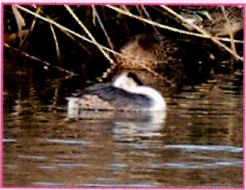
カイツブリ目カイツブリ科 カンムリカイツブリ