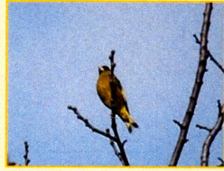
アトリ科：カワラヒワ