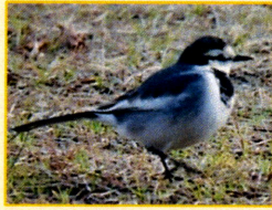
セキレイ科：ハクセキレイ