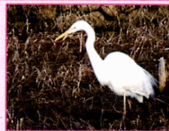
ペリカン目サギ科 ダイサギ