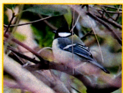
シジュウカラ科： シジュウカラ