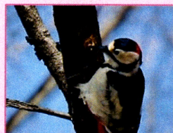
キツツキ目キツツキ科 アカゲラ