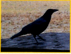
カラス科：ハシボンガラス