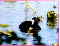
ツル目クイナ科 オオバン