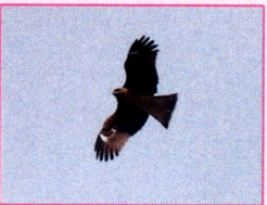
タカ目タカ科 トビ