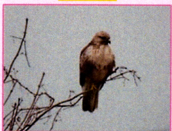
タカ目タカ科 ノスリ